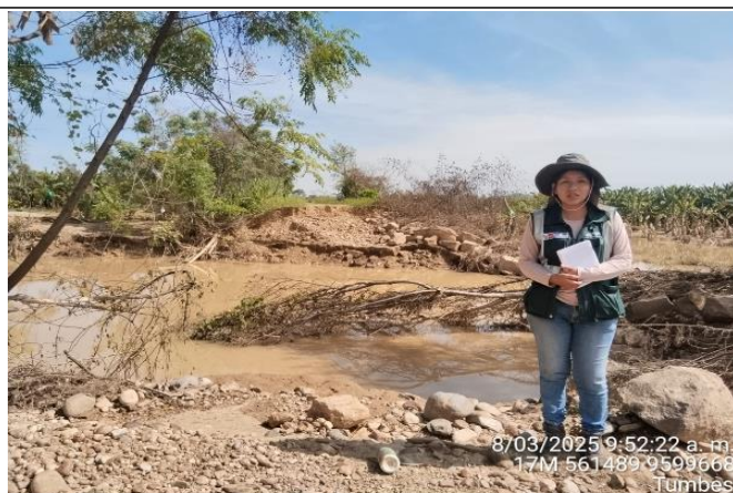
FIGURA N°03: TROCHA CARROZABLE EROSIONADA POSTERIOR AL DESBORDE DEL RÍO TUMBES EN EL SECTOR LOS CRISTALES.