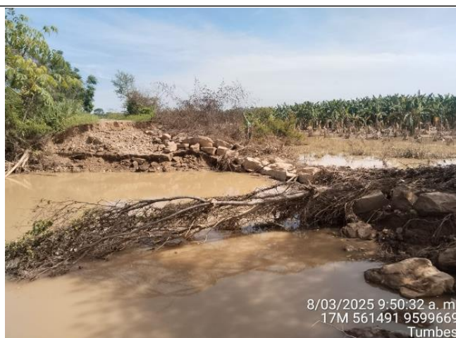
FIGURA N°02: CULTIVOS DE PLÁTANO AFECTADOS POSTERIOR AL DESBORDE DEL RÍO TUMBES.