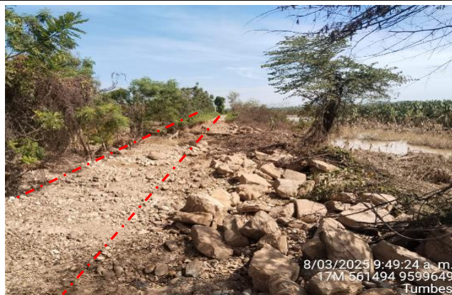
FIGURA N°01: TRAMO CRÍTICO EN EL RÍO TUMBES, EN EL SECTOR CRISTALES, DISTRITO DE CORRALES, PROVINCIA DE TUMBES.